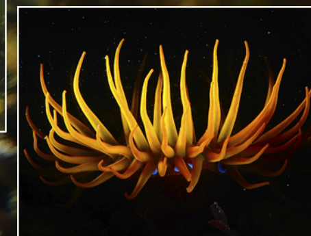
Op tijd beginnen! Het was afgaand water, dus de paardenanemoon moest als eerste op de foto.