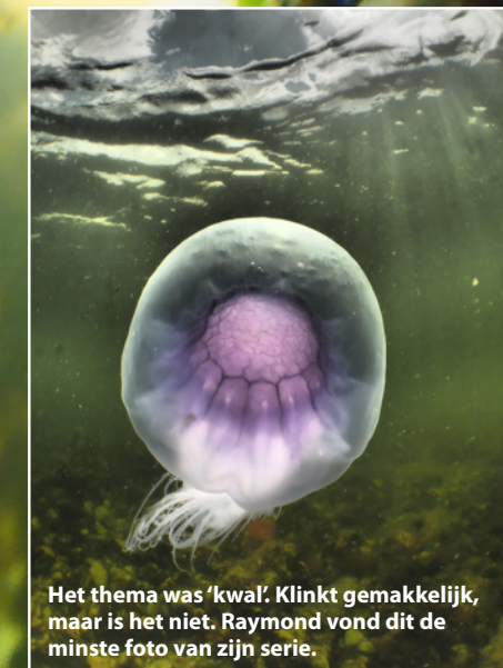
Het thema was 'kwal'. Klinkt gemakkelijk, maar is het niet. Raymond vond dit de minste foto van zijn serie.