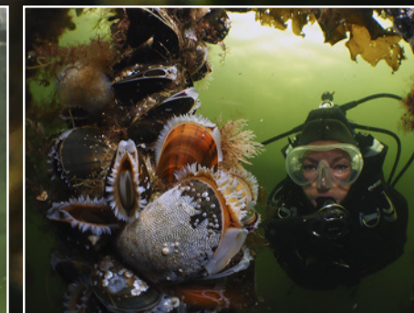
De 'groothoek met duiker' was volgens hem zijn beste foto.