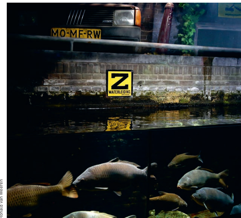
Ronald van Weeren

Aantal duikers Nederland 30.500 Aantal duiken Per jaar in Nederland 800.000 Gemiddelde kosten Beginnersduik 50 euro inclusief materiaal Gemiddelde duur duik 60 minuten