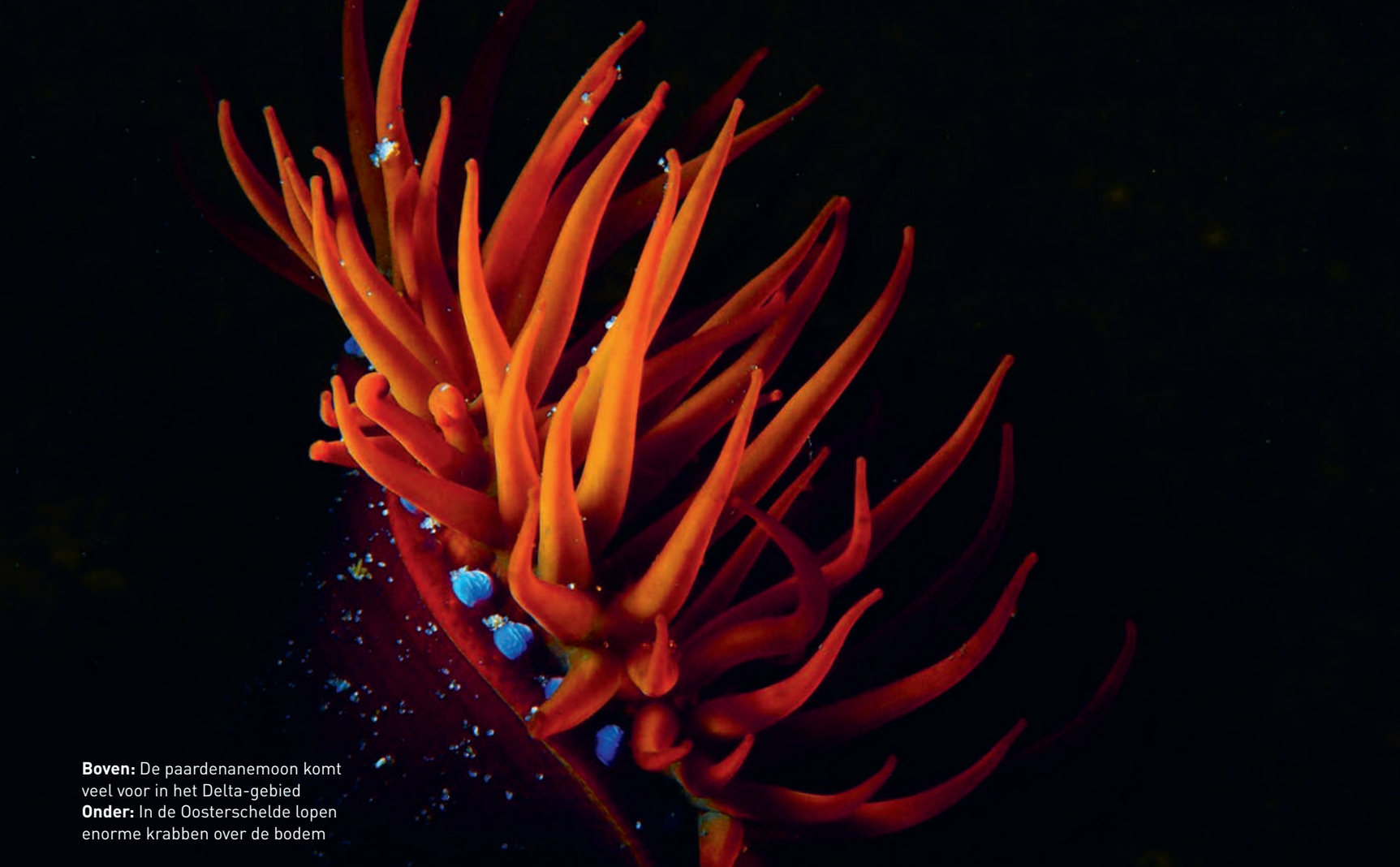
Boven: De paardenanemoon komt veel voor in het Delta-gebied Onder: In de Oosterschelde lopen enorme krabben over de bodem